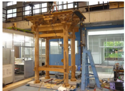
伝統木造架構の振動台実験

材料構造実験施設では、建築構造物や部材特性を検証するための、様々な実験装置があります。例えば、地震の揺れを再現し、建物の耐震性を評価・検討する振動台、最大20tonの力で加力し構造物の破壊現象を再現する動的アクチュエータ、何万回もの連続的な加振を行ない構造物の疲労による破壊現象を検討する疲労試験機等があります。建築学科ではこれらの設備を使って、建築構造や建築材料に関する実験を、授業・卒業研究で行っています。