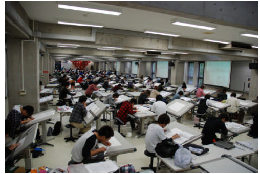
製図室での製図実習

建築家が設計をした建物を実際に建設するためには、その建物がどのような形をしているのかを表現した図面をまとめなければならないことは、皆さんもご存じだと思います。建築学科ではプロとして設計図面をまとめる技術を習得するために、製図室において1人1台の製図板が与えられています。1年生から製図の基礎を学び、小規模なお店や住宅の設計で設計の基礎を学んで3年生では集合住宅やオフィスビルなど大規模な建物の設計までできるような技術を習得していきます。また、設計意図を伝えるための模型作成や、コンピュータによって作図した大判の図面をプリントアウトするためのワークショップという部屋も準備されています。