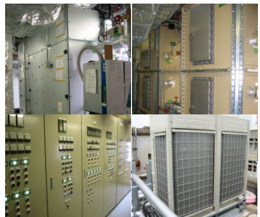
空調用制御盤(左)と室外機(右)

現代の建物は、冷暖房が施され、いつでも快適な空間を提供しています。そして建設における、空調などの建築設備の重要性は年々増加しています。重要である空調ですが、日本の多くの大学では残念ながらその仕組みが十分に教えられているとは言えません。中部大学では、全国でも珍しく設備を専門とする教員が充実し、さらに空調設備を実践的に学ぶことのできる建築環境・設備実験室が整備されています。この施設は、氷蓄熱槽を備え、あらゆる空調システムの仕組みを学び実験できる、わが国でも稀な施設です。