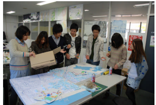
ワークショップでの模型製作