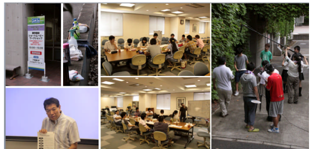
トシケン・ザ・ムービー2012 ショートムービーワークショップ 2012. 8. 5~7 中部大学キャンパス

ホントに3日間で映画ができるなんて・・・と、参加者は驚きながらも作品を仕上げ、満足そうでした。今年度の成果をもとに、来年度以降も映像を活用した「まちづくり」教育の充実を進めています。